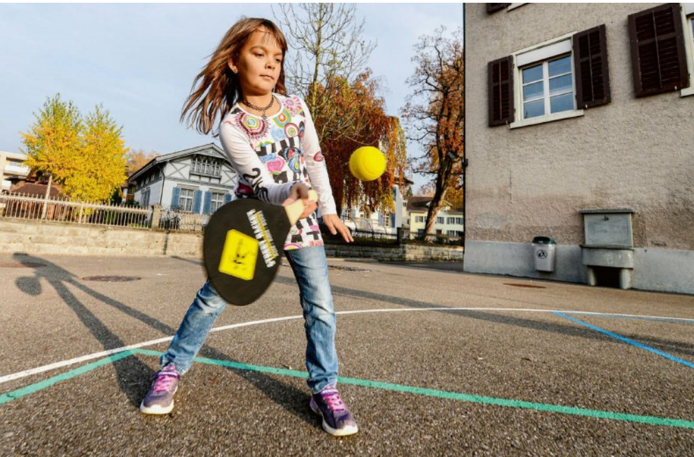
Spielen statt gamen, am besten an der frischen Luft: Das Konzept Street Racket tut der Gesundheit von Jung und Alt gut.

Street Racket kann ohne Aufwand drinnen wie draussen gespielt werden und bietet viele spannende kooperative und kompetitive Spiel- und Übungsformen sowie Einsatzbereiche. Der Verein Street Racket unterstützt Gemeinden bei der Einführung.