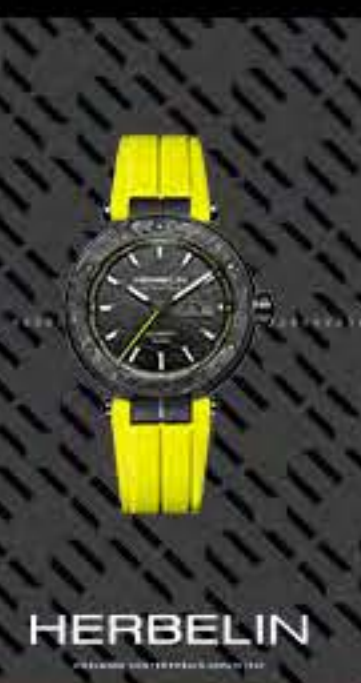
45 RASMUS NARJES