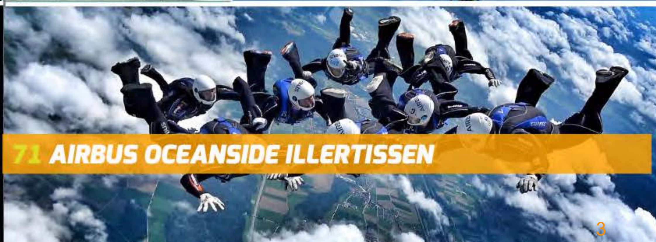
71 AIRBUS OCEANSIDE ILLERTISSEN