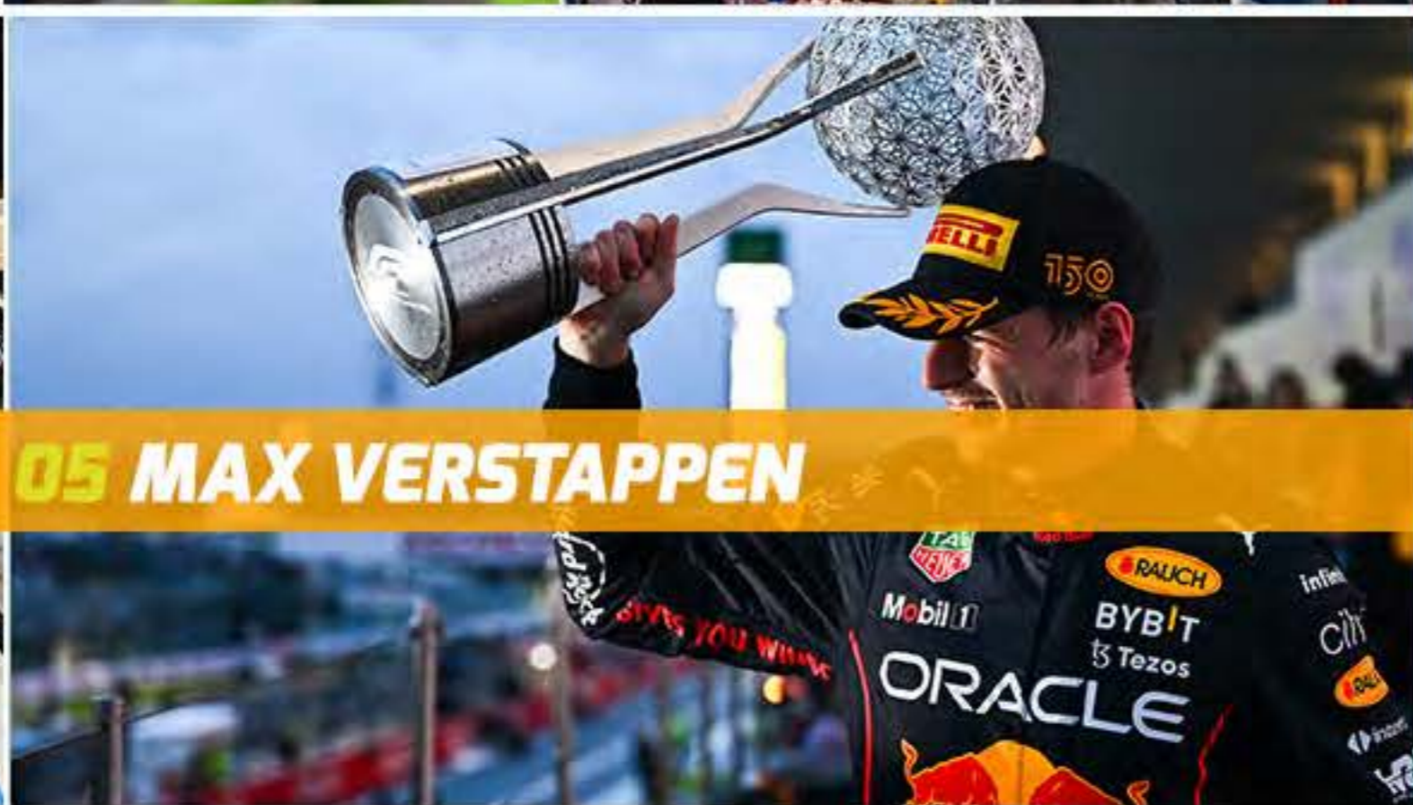
05 MAX VERSTAPPEN