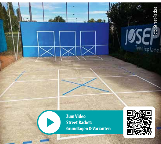
Street Racket macht aus jedem Stück Boden einen Spielplatz.

Die Umsetzung ist leicht gemacht: Interessierte Betreiber erhalten von Street Racket eine Nutzererlaubnis für das geschützte Konzept und Spielfeld. Gleichzeitig profitieren neue Partner von Sonderpreisen für das Original-Spielmaterial und Einführungs-Workshops. Das offizielle Regelplakat mit leicht verständlichen Piktogrammen und die kostenfreie Street Racket App mit über 100 Spieformen machen das Bewegungskonzept sofort und für jeden verständlich.