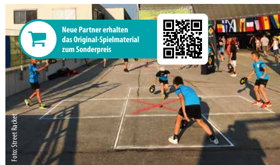
Sinnvolle Nutzung weiterer Flächen auf dem Areal.